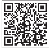
宝塚すみれ墓苑 説明会HP